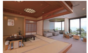
▲ 離宮 和洋室 2ベッド／一例

IN - 3:00PM OUT - 10:00AM 交通 - JR指宿駅 車約7分