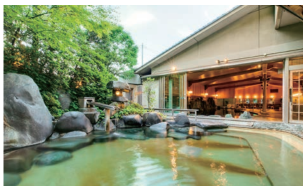
▲ 大浴場「木肌の湯 浮殿」(男性用)

情緒あふれる湯の街玉造温泉に立つ、やすらぎと楽しさを調和させた現代数寄屋造りの宿。旬を生かし四季折々の味わいある料理を楽しめます。最上階の展望露天風呂など、趣の異なる4つの大浴場で心に浸みいるくつろぎの湯を満喫ください。