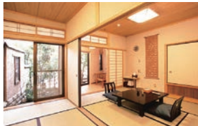
▲ 蕨 和室 露天風呂付／一例

IN - 3:30PM OUT - 11:00AM 交通 - JR霧島神宮駅 車約20分