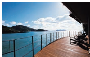
▲ デッキテラス「海の栈敷」

IN - 3:00PM OUT - 11:00AM 交通 - JR福山駅 バス約30分、 鞆港バス停から徒歩約5分