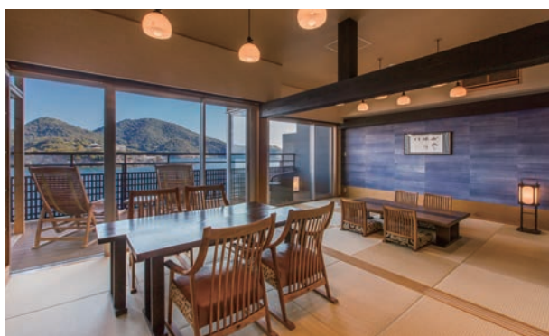
▲ 和洋室露天風呂付(アップアースイトルーム)／一例

食事は瀬戸内の幸や季節ごとの素材も活かし、四季折々の変化に富んだオリジナル創作会席を召しあがれます。全室温泉給湯の露天風呂付客室で和モダンな宿です。各客室のウッドデッキに上つらえた露天風呂からは、瀬戸内海のぜいたくな眺めを楽しめます。