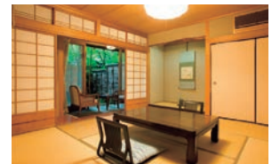
▲ 1階 露天風呂付客室／一例

IN - 3:00PM OUT - 11:00AM 交通 - JR由布院駅 車約5分