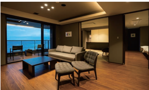
▲ GAHAMAタワー 和洋室 半露天風呂付／一例

松林が美しい海岸通り「上人ヶ浜」に位置する静かに時間を楽しむための隠れ家的な宿です。「GAHAMAタワー」ではフロアに2室しかないぜひいたくな空間と時間をお過ごしください。