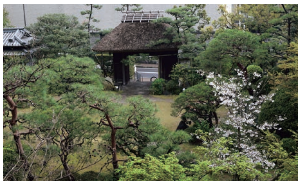
▲ 春の庭園桜と芽誓の門

創業390年余り、皇室ご来県の際の御用達の宿としても有名な老舗旅館。夏目漱石、正岡子規など多くの著名人も訪れています。1,500坪の広大な日本庭園は自然の川が流れ、約200種類の植物が群生。旧門は記念撮影スポットにもなっています。