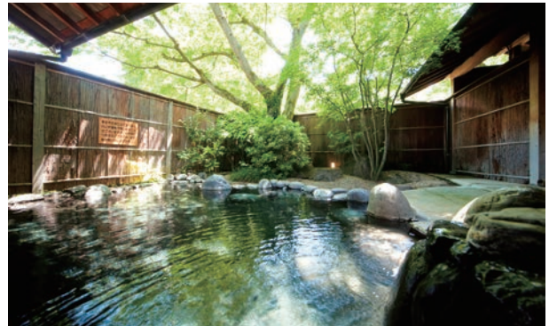
▲ 露天風呂「源流の湯」

金鱗湖から徒歩約5分。由布院にひっそりとたたずむ、心地のよい静けさに包まれた純和風の宿。敷地内から湧き出る温泉と客室の露天風呂、そして由布院の風情に、ぜひたくに浸かってください。