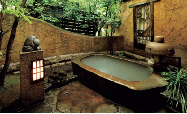
▲ 客室露天風呂／一例

家庭的な雰囲気を大事にする、全室露天風呂付6室のみの宿。温泉は硫黄泉ですべてかけ流し。2代目のオーナーシェフが作る料理は評価も高く、霧島の摘み草や山菜を使った懐石料理。「何もしないぜいたく」を味わいたい方におすすめの宿です。