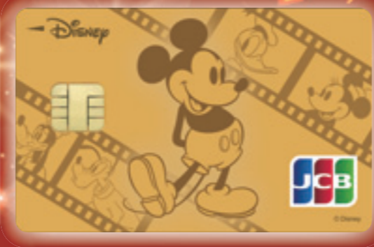
ミッキー・マウス&フレンズ